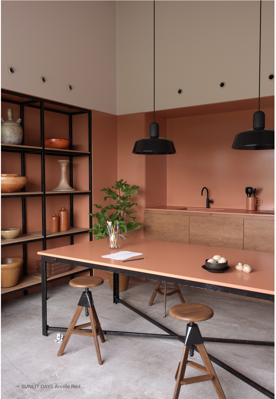
→ SUNLIT DAYS Arcilla Red