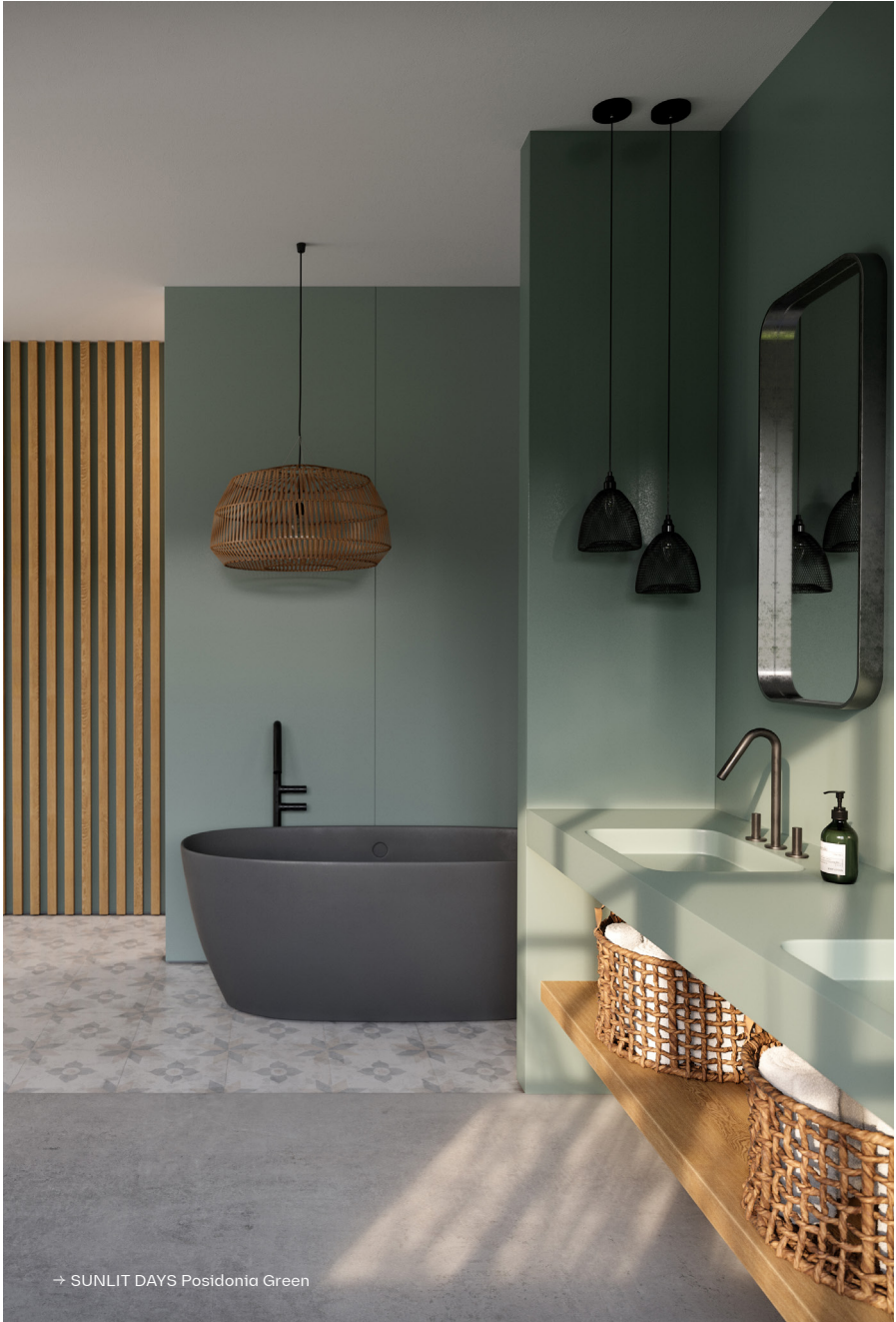
→ SUNLIT DAYS Posidonia Green